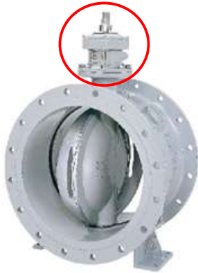
センターキャップ式